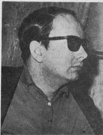
ALFREDO GUEVARA: el arte cinematográfico en la revolución

R: La cinematografía cubana surge con el triunfo revolucionario, y la ley que crea sus instrumentos de trabajo, promulgada el 24 de marzo de 1959, o sea, tres meses después de la entrada de Fidel en La Habana. Se ofreció al