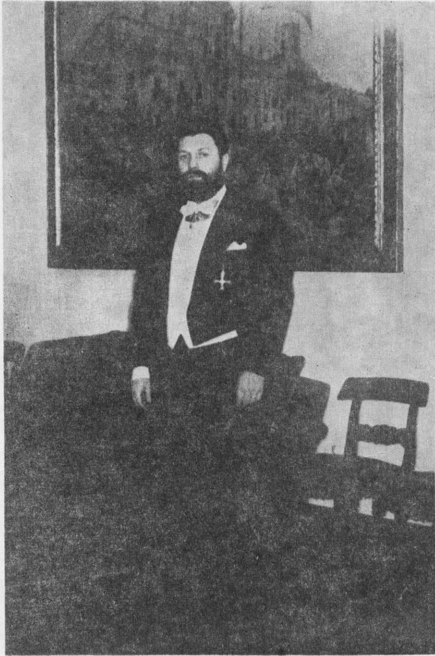
GERMAN BECKER URETA

“EN EL GOBIERNO DE FREI HABRA BUENA PLATA”