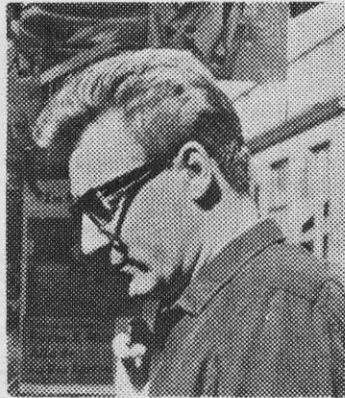
PATRICIO MANNS: vocación de rebeldía

sangre/ mis manos de labrador." Y en la misma canción (Alta Lanza): "Adiós, amor: guerrillero/ desde esta mañana soy:/ cuelga mi beso en tu boca/ y así sabrás donde estoy." Vuelve a hablar con su amada el protagonista, el inmenso pueblo, en "Vidalay del montonero": "...quién sabe si los fusiles/ me dejarán que te tenga..." ¿Por qué? Porque "nos tumbaron el pingo/ ya llegó el gringo". ¿Y de dónde llega el mister? El pueblo y su intérprete, su amauta, su cantor, lo saben: "Qué