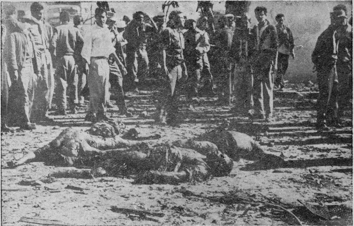
VARIOS CAMPESINOS fueron asesinados por los contrarrevolucionarios que, equipados por la CIA, desembarcaron en las costas de Baracoa en abril de 1970. En aquella oportunidad, Fidel Castro notificó al imperialismo: "¡Los hombres podemos caer, pero las ideas que defendemos no caerán jamás!".