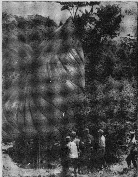
LA CIA HA LANZADO en paracaídas cientos de toneladas de armamento moderno, destinado a las bandas contrarrevolucionarias que ha intentado promover en Cuba.