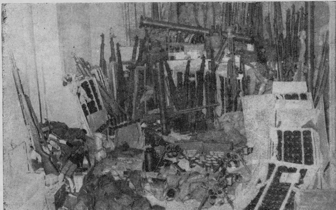
ASPECTO DEL armamento y equipo que la CIA introduce en Cuba para sus agentes, utilizando desembarcos en playas solitarias y lanzamientos en paracaídas.

17 de mayo. —Una lancha pirata procedente de Estados Unidos es capturada cuando ope-